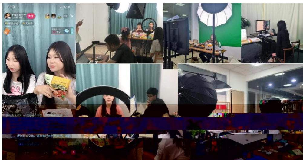
图 组织学生开展实习实训