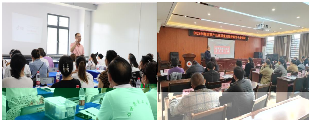
图 企业协助学校为湘西茶企开展电商直播培训

更 对 电 的 。 过 的 ， 茶 得 更 地 电 播的操 、 策 等方 的 ， 电 的 奠定 础。