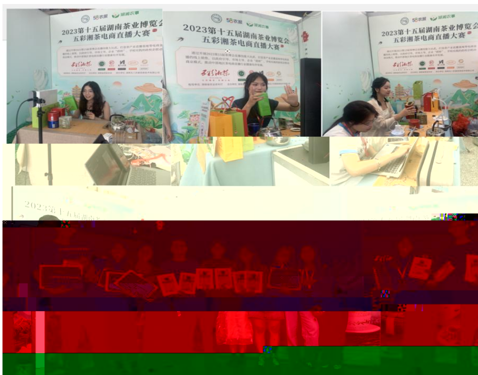
图 “湖南省第十五届茶博会” 电商直播比赛现场

播和方的，短 得的步。 队比 10多单、单， 包但不、等多个，的 和队得的高度。的 得不对公的，更对参 付出和的充分定。