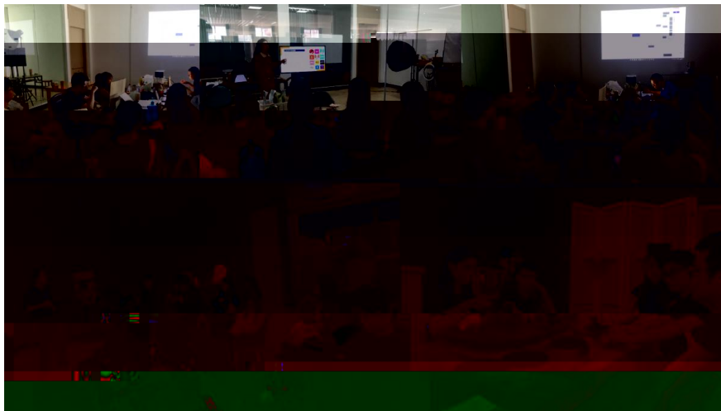
图 特邀企业专家来基地为学生进行专业培训

地 2023 地 ( 2), 供 宝贵的 。 过 的分 , 度 、 场变 , 对电 播 的 。 不 的 储备, 高 操 , 的 发 奠定 础。 措 合 的 度, 地 合 的 。